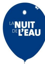
50 ballons de baudruche