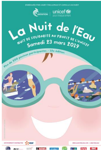
(En cours d'actualisation)